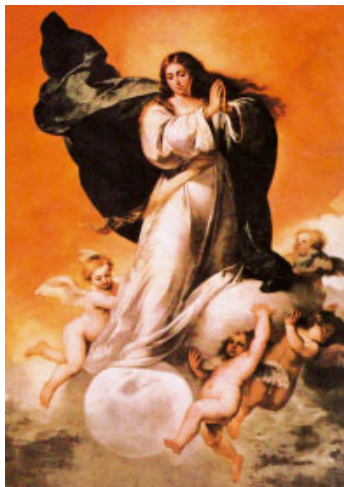
Immaculada Concepció. Pintura de Murillo, Museu de Belles Arts (Sevilla)

Maria fou Immaculada perquè esdevindria mare del Fill de Déu. Sant Sofroni, bisbe, deia a Maria en un sermó: «Sou realment beneïda entre les dones, perquè si per naturalesa fóreu dona, en veritat us convertíreu en mare de Déu.» La seva immunitat original fou possible gràcies als mèrits futurs de Crist. Maria, certament, també fou redimida, i ho fou primer que ningú; la redimida de la manera més sublim, el fruit més digne i el trofeu més excels de la Redempció.