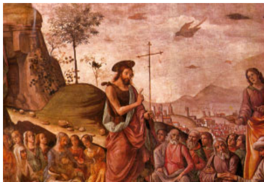
Predicació de sant Joan Baptista. Pintura de Domenico Ghirlandaio, església de Santa Maria Novella (Florència)

«Aquí está vuestro Dios. Mirad, el Señor Dios llega con poder, y su brazo manda. Mirad, viene con él su salario, y su recompensa lo precede. Como un pastor que apacienta el rebaño, su brazo lo reúne, toma en brazos los corderos y hace recostar a las madres.»